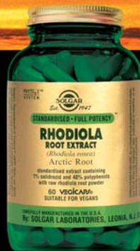
SFP Rhodiola Root Extract Το μυστικό της αναζωογόνησης