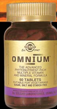
OMNIUM Προηγμένη αντιοξειδωτική προστασία και τόνοση